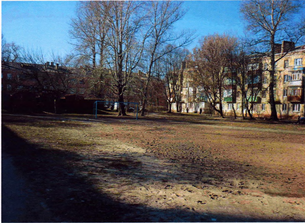
Зовнішній вигляд майданчика на теперішній час