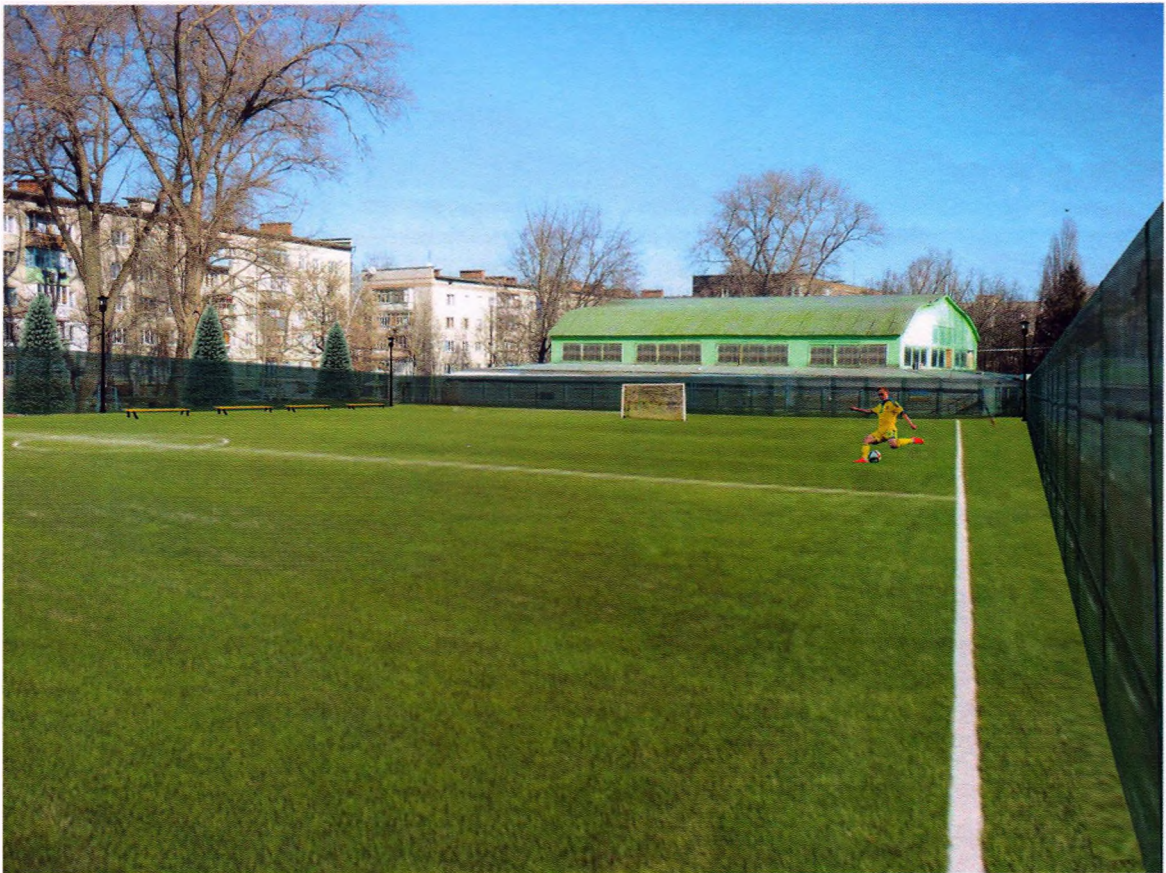
Зовнішній вигляд майбутнього майданчика