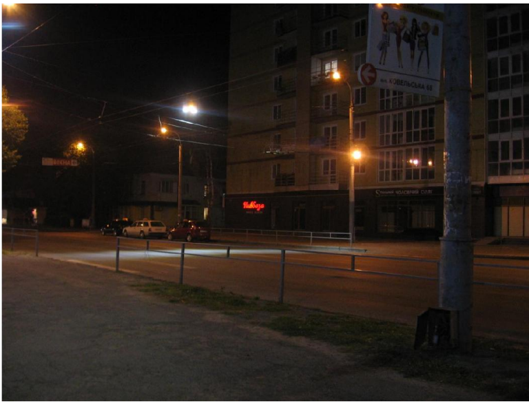
Фото з Луцька. В момент, коли пішохід переходить дорогу у вечірній час, ліхтар підсвітлює його, що дає можливість водію заздалегідь побачити пішохода.