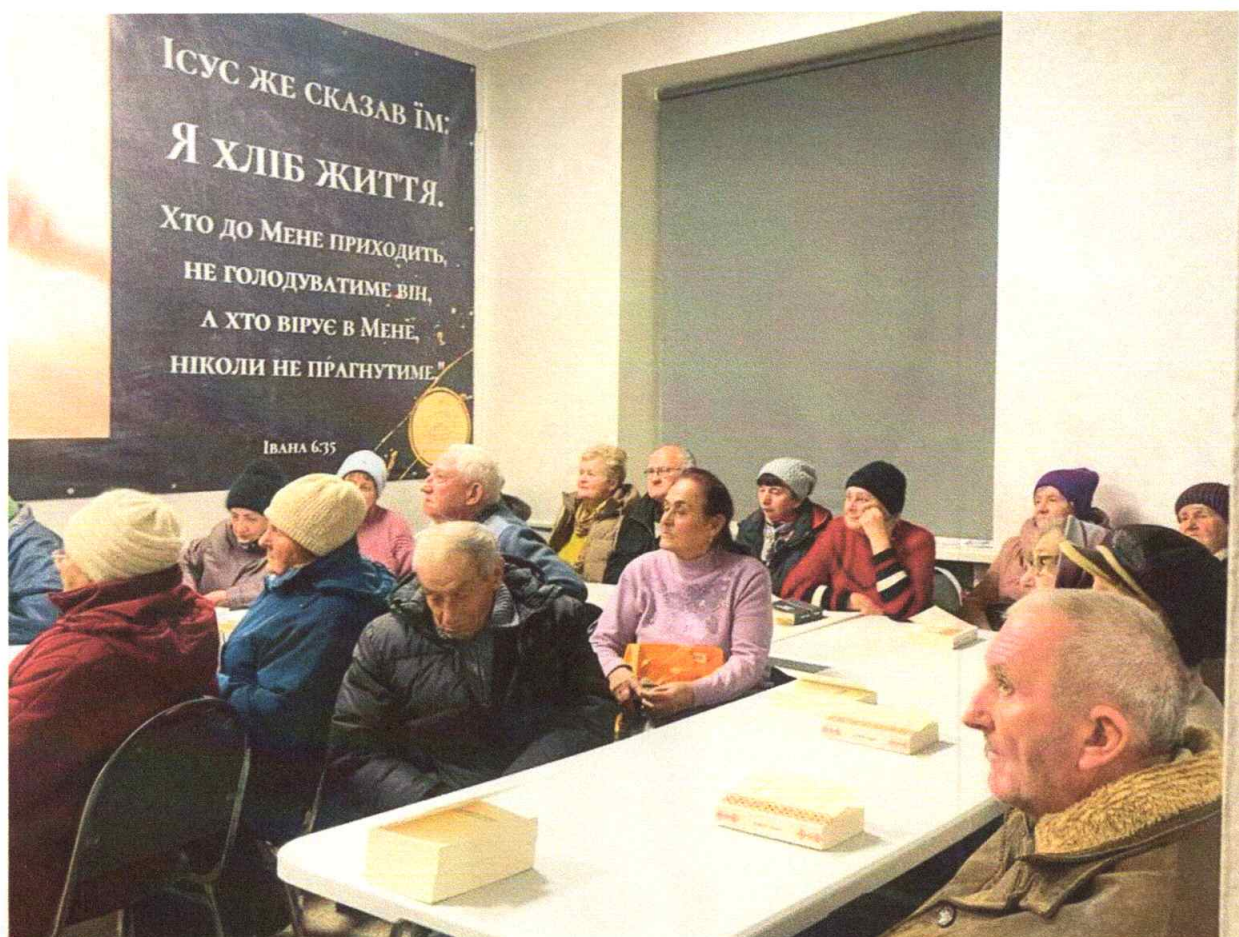
Душеопікунська підтримка населення, зустрічі із ВПО