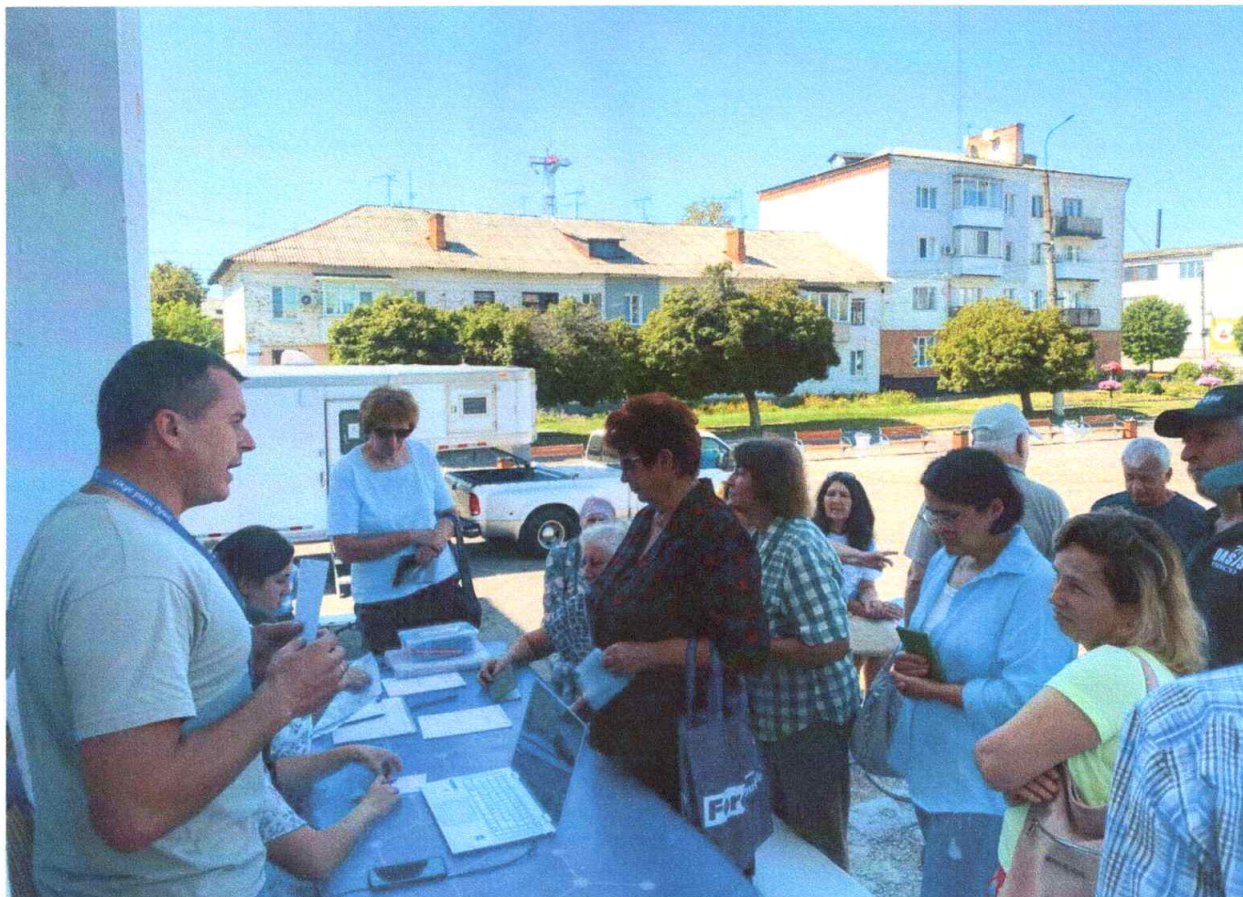
Благодійний виїзд Християнської Мобільної Медичної Команди