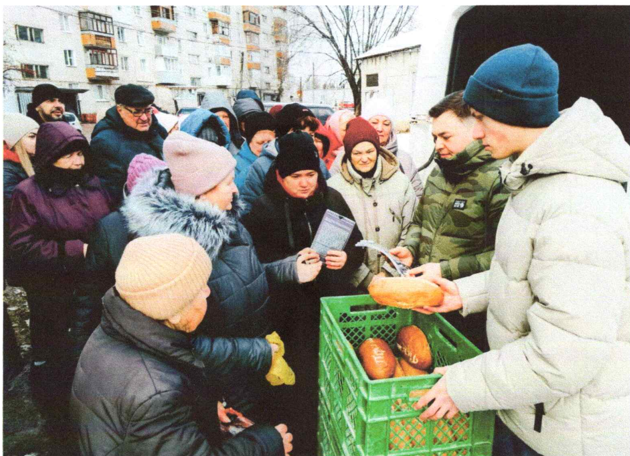
Роздача хліба «Перемога»