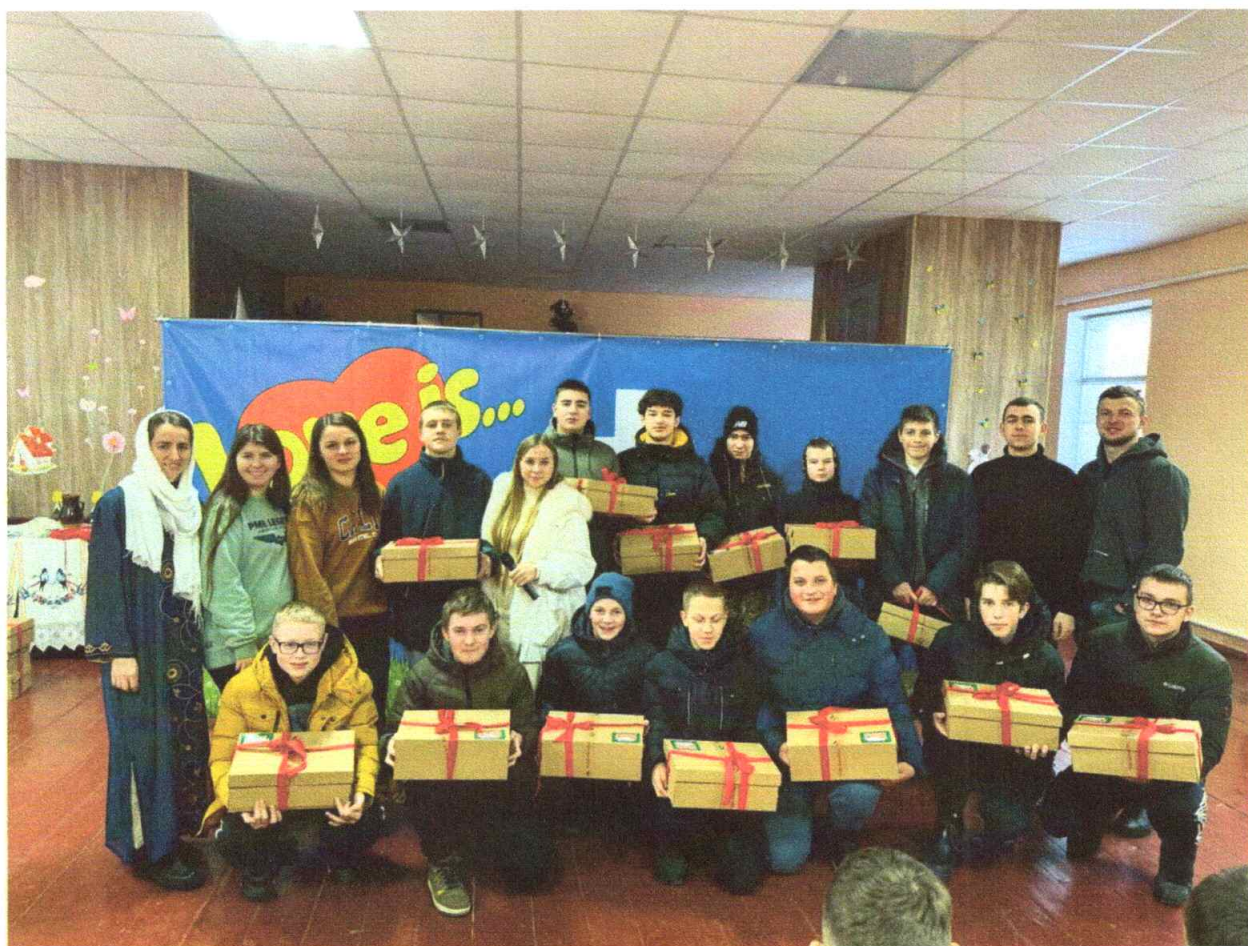
Дитячі заходи «Подарунок Неба»