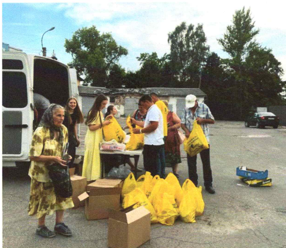
Забезпечення продуктами та засобами особистої гігієни