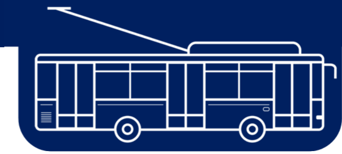
Схема руху міського електричного транспорту