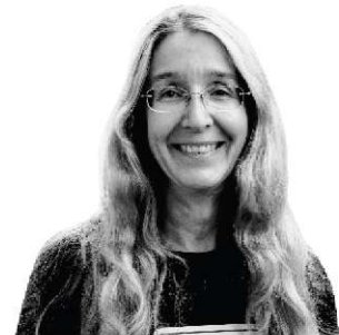
Доктор Уляна Супрун, в.о. Міністра охорони здоров'я

Те, що не увійде до програми «Доступні ліки», буде включено в тарифи на послуги, які, згідно з реформою, будуть закуповуватись у лікарнях з 2020 року.