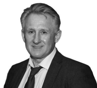
Роман Ілик, заступник Міністра охорони здоров'я України

Кожен лікар, лікуючи свого пацієнта, хоче бути впевненим, що хворий виконує його призначення. Адже результат лікування залежить від дотримання рекомендацій лікаря та систематичного прийому ліків. Передусім це стосується пацієнтів, які мають хронічні захворювання і повинні приймати ліки постійно. Зараз лікар не має можливості в цьому переконатися — він може тільки спонукати, переконувати й заохочувати. З появою е-рецепта лікар зможе впевнитися, що пацієнт принаймні відвідав аптеку та отримав призначені ним ліки.