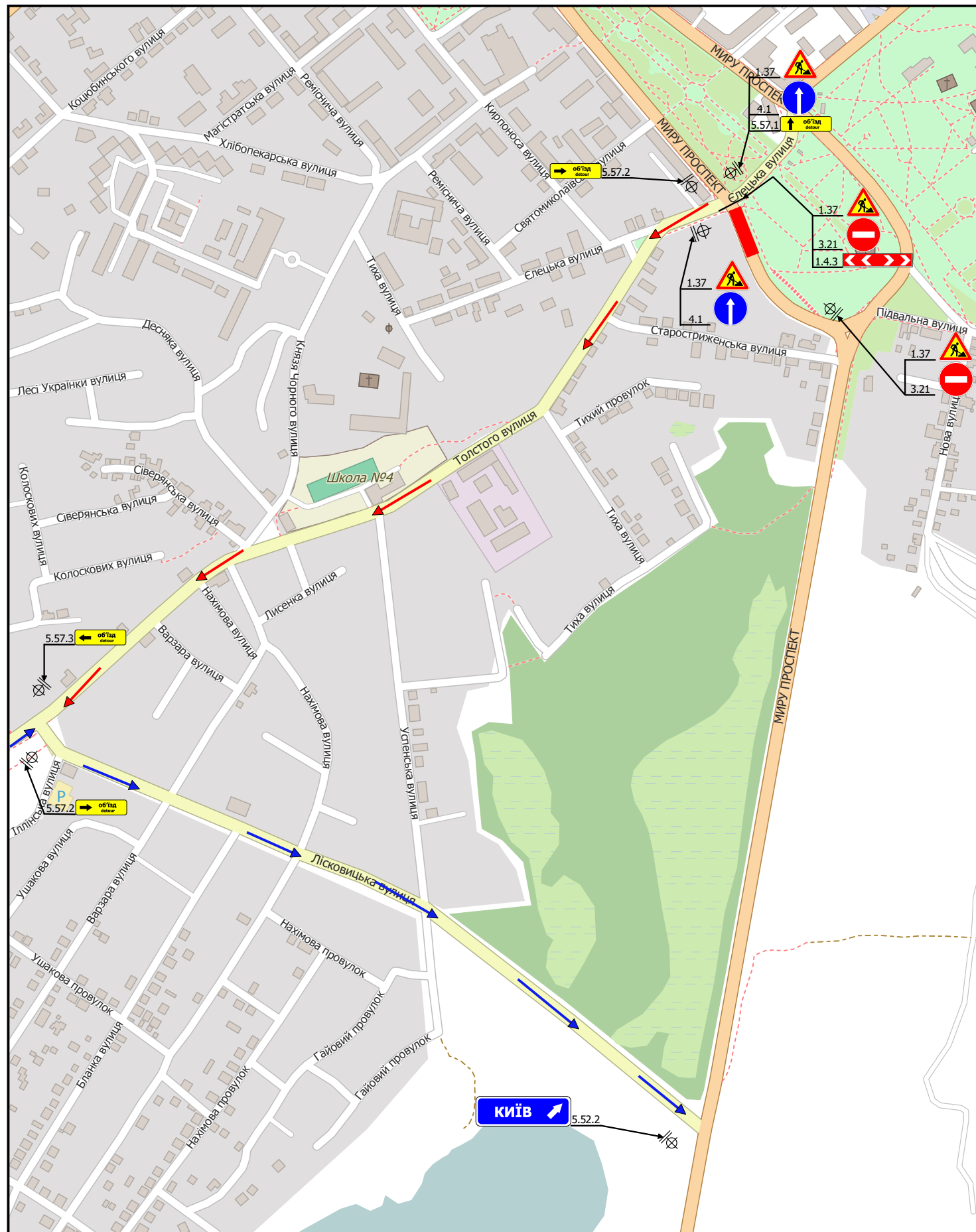
СХЕМА організації дорожнього руху на час виконання робіт

Дозвіл № _____ ВІД _____ р. Початок робіт _____ р. Закінчення робіт _____ р.