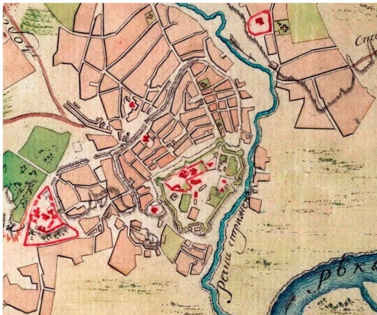
Фрагмент плану Чернігова 1784 року

(Опис публікується за «Описи Чернігова 60-х років XVIII ст. (підготовка до друку і передмова Олександра Коваленка та Ірини Петреченко // Сіверянський літопис № 4 (16). 1997. С. 167-173. Текст містить деякі редакторські адаптації для полегшення читання)