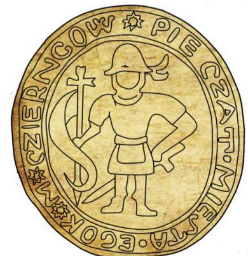
Печатка Чернігівського магістрату середини XVII ст.

Окрім герба, чернігівський магістрат мав і свій прапор. На жаль, він не зберігся до нашого часу. Однак існує його детальний опис. Прапор був трикутний, синього кольору із жовтою лиштвою по краям. На лицьовій стороні прапору був вишитий воїн у золотих обладунках, на голові у нього золотий шолом, увінчаний 3 страусовими пір'їнами (білого, червоного та чорного кольорів); на плечах - червоний плащ, на грудях на чорній стрічці висить золотий хрест, лівою рукою (рукав зеленого кольору) він тримає розпущене червоне знамено із золотим хрестом, а правою рукою (рукав зеленого кольору) - шаблю; шабля підвішена до пояса двома чорними ремінцями, на ногах чорні штани та жовті чоботи, вкриті візерунками. Держак прапора коричневого кольору, увінчаний золотою кулею з хрестом.