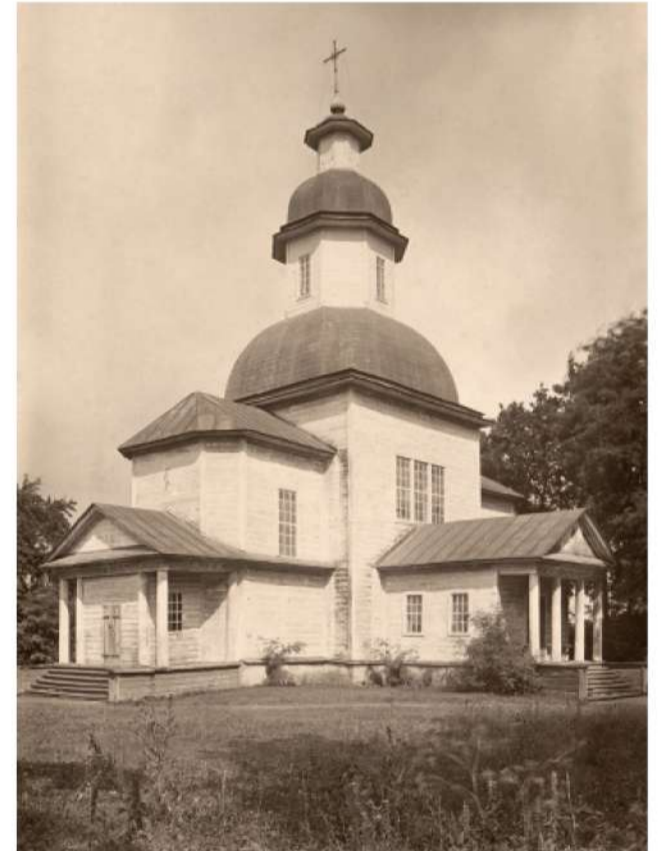
Георгієвська церква на Бобровиці у 1928 р.

То ж як бачимо, що сучасний чернігівський район Бобровиця за свою більш ніж тисячолітню історію встиг побувати невеликим містечком з укріпленнями в околиці Чернігова, перебував пустою після монгольського погрому, пережив відновлення як село Бобровиця з елітарними садибами козацької старшини, та в решті-решт увійшло поступово до складу Чернігова і сьогодні є одним з найбільших районів міста, що зберігає свою історичну назву.