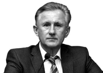
Роман Ілюк Заступник міністра охорони здоров'я

Урядова програма «Доступні ліки» успішно впроваджувалася минулого року. Кожна третя аптека добровільно бере участь у програмі — нині їх 6 744. Програма користується популярністю у пацієнтів: за 8 місяців роботи пацієнти отримали ліки майже за 12 мільйонами рецептів на суму понад 500 млн грн. За час, коли програма набирала обертів і їй почали довіряти, кількість пацієнтів збільшилася у 10 разів, і це наша спільна перемога.