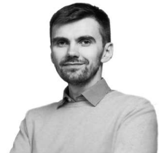
Павло Ковтонюк Заступник міністра охорони здоров'я

Для керівників закладів головним завданням буде реорганізація в некомерційні комунальні підприємства. Це дасть закладу можливість мати значно більше свободи у прийнятті щоденних рішень, мати рахунок закладу в банку,